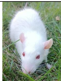
Tikus Putih Jantan