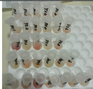
Sampel Serum Tikus