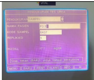
Foto hasil Urea pemeriksaan pada fotometer