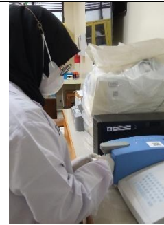
Pemeriksaan Kreatinin dan Urea Serum