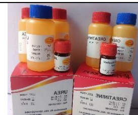
Reagen Kreatinin dan Urea