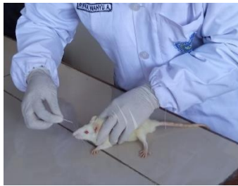
Pengambilan Darah Tikus